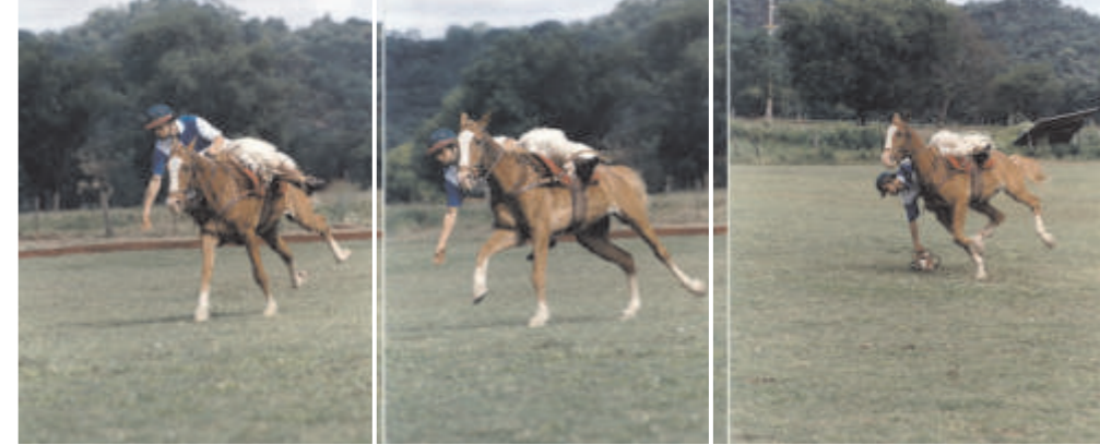
Levantando el pato

Refiriéndose este escritor a los guasos u hombres del campo, nos informa que para jugar una partida de pato "se junta una cuadrilla de estos guasos, que todos son jinetes más allá de lo creíble; uno de ellos lleva un cuero con argollas, y el brazo levantado; parte como un rayo llevando 150 varas de ventaja, y a una seña, él y todos corren a mata-caballo, formando grita como los moros: todos persiguen al pato y pugnan por quitarle la presa; son diestrisimas las evoluciones que éste hace para que no lo logren, ya siguiendo una carrera recta, ya volviendo a la izquierda, ya rompiendo por medio de los que siguen, hasta que alguno, o más diestro o más feliz, lo despoja del pato, para lo que no es permitido que lo tomen del brazo. En este momento todos vitorean y le llevan entre los aplausos, alaridos y zamba al rancho suyo, al que frecuenta, o bien al de la dama que pretende. Reinan todavía entre estas gentes muchos restos de la antigua gallardía española".