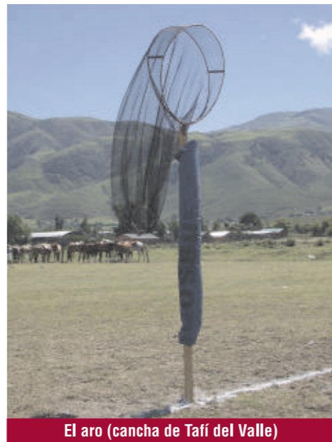
El aro (cancha de Tafí del Valle)