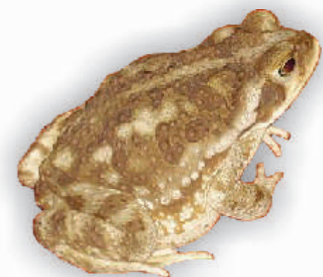
Bufo arenarum (sapo comun)

Suelen dormir de día en sus cuevas y de noche salen a comer insectos.