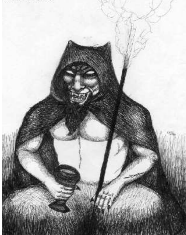
"Luz Mala" - Dibujo - CATU

El día de San Bartolomé (24 de agosto) es el más propicio para verlos, ya que es cuando parece estar más brillante el haz de luz que se levanta del suelo y que, por creencia general, se debe a la influencia maligna, ya que popularmente estiman que es el único día en que Lucifer se ve libre de los detectives celestiales y puede hacer impunemente de las suyas (Ambrosetti, "Supersticiones y leyendas").